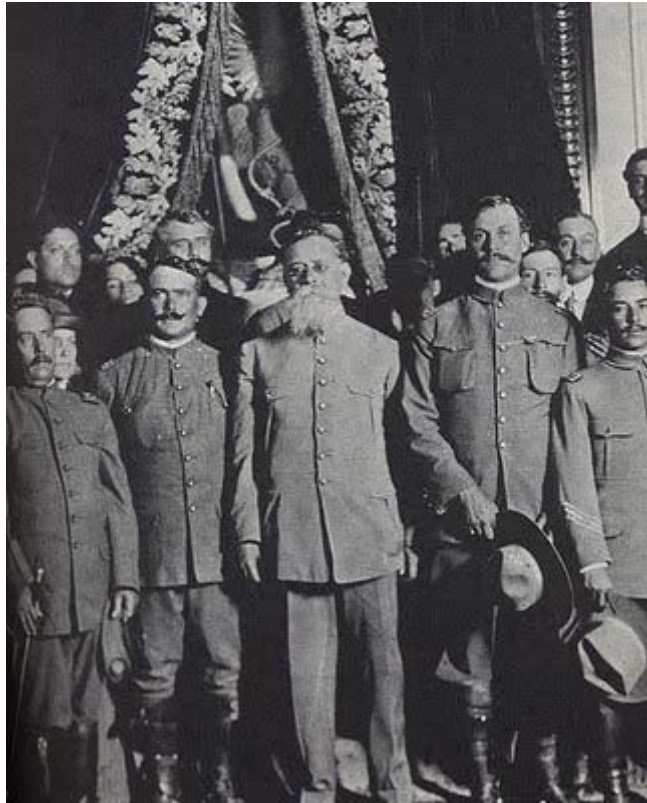
General Venustiano Carranza

La ropa de cada general tenía diferentes características y había que fabricar moldes especiales para ellos. Don Venustiano Carranza usaba un saco tipo guerrera recta con botones metálicos al frente, con cuello cerrado y tirilla de celuloide al interior: sombrero de fieltro muy alto de cuatro pedradas.