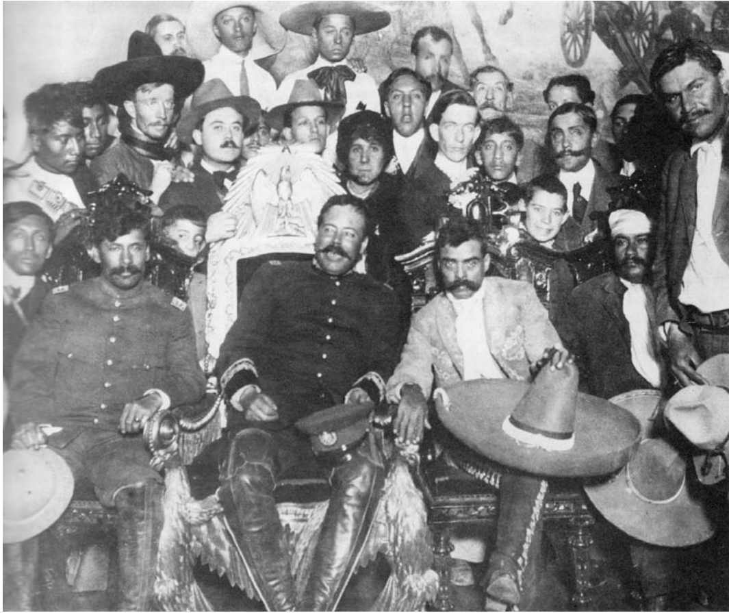
General Francisco Villa

El General Álvaro Obregón vestía muy correctamente, apegándose siempre al estilo de la ropa reglamentaria militar de la época y siempre usó la gorra o kepi militar y usaba camisa y pantalón recto en campana y saco militar tipo inglés en ceremonias y actos oficiales.