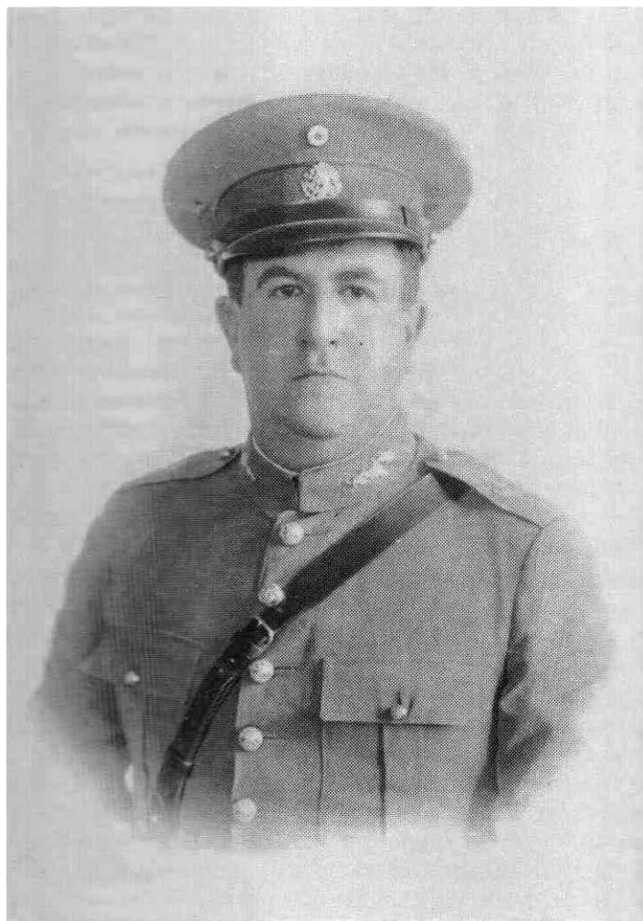
General Manuel Ávila Camacho