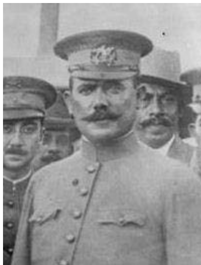
General Álvaro Obregón

El General Álvaro Obregón vestía muy correctamente, apegándose siempre al estilo de la ropa reglamentaria militar de la época y siempre usó la gorra o kepi militar y usaba camisa y pantalón recto en campana y saco militar tipo inglés en ceremonias y actos oficiales.